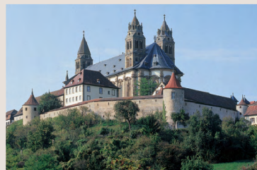
Das ehemalige Benediktinerkloster Comburg in Schwäbisch Hall.