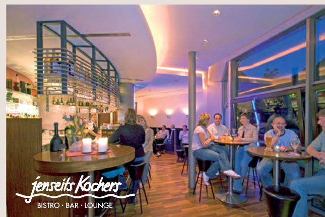
Die Bistro-Küche ist täglich ab 17 Uhr bis 23 Uhr geöffnet.

Zum Ausklang des Tages empfehlen wir einen Abstecher in unsere Bistro Bar „jenseits Kochers“. Der zwanglos-gesellige Treffpunkt lockt täglich von 17 Uhr bis 1 Uhr mit raffinierten Cocktails, Wein und Whiskey, Fassbier, frischen Säften und diversen Kaffee-Spezialitäten. Auf der umfangreichen Bistrokarte finden sich köstliche Suppen, pikante Snacks, Sandwiches, preiswerte Tellergerichte u.v.m.