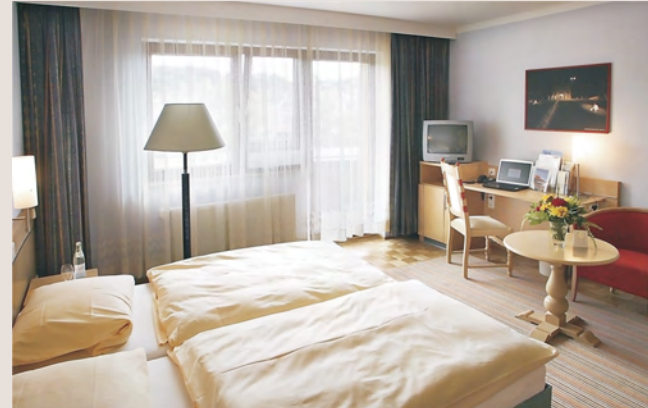
Komplett neu eingerichtet in hellen, freundlichen Farben: Zimmer für Einzel- und Doppelnutzung in Haus 1.