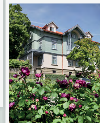
Wohnen im historischen Ambiente der alten Stadtvilla – Haus 2