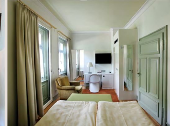
Klimatisiertes Apartment mit Arbeitsplatz, LED-TV, Kleinküche und Essecke in der Stadtvilla – Haus 2.