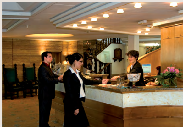
Erste Anlaufstelle für die Gäste des „hotel-21.de“: die Rezeption des Ringhotel Hohenlohe.

Reservierung und Chipkartenausgabe rund um die Uhr über die Rezeption des Ringhotel Hohenlohe.