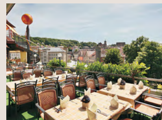
Sommerterrasse mit Blick auf die Altstadt.

Voll- bzw. Halbpension oder mal eine Stärkung zwischendurch erwünscht? Das Ausblicksrestaurant mit Menü-Auswahl, Lobby-Café, Sommerterrasse und die Bistro Bar „jenseits Kochers“ bieten für jeden Geschmack etwas.