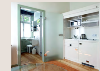
Apartment Typ 2 mit Kleinküche, zu der auch zwei Kochplatten gehören.

Die einen setzen sich gerne an den gedeckten Tisch, für die anderen ist die eigene kleine Küche, in der man sich zwischendurch mal ein Süppchen kochen kann, der wahre Luxus. Die Nutzung ist ab 30 Tagen Aufenthalt im Apartmentpreis enthalten.