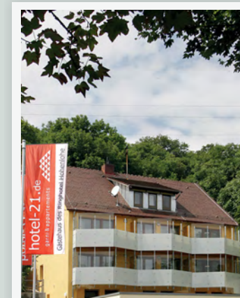
Modernes Stadthotel mit Blick auf die Altstadt – Haus 1

Zum Ausklang des Tages empfehlen wir einen Abstecher in unsere Bistro Bar „jenseits Kochers“. Der zwanglos-gesellige Treffpunkt lockt täglich von 17 Uhr bis 1 Uhr mit raffinierten Cocktails, Wein und Whiskey, Fassbier, frischen Säften und diversen Kaffee-Spezialitäten. Auf der umfangreichen Bistrokarte finden sich köstliche Suppen, pikante Snacks, Sandwiches, preiswerte Tellergerichte u.v.m.