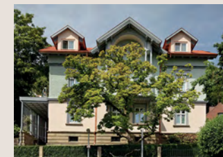
Außenfassade der 1882 erbauten Villa nach der Sanierung im Frühjahr 2011.

Die aufwändig restaurierte, denkmalgeschützte Gründerzeit-Villa verfügt über 12 Zimmer (3 EZ, 5 DZ und 4 Apartments) zwischen 16m 2 – 38m 2 . Die alten Stuckdecken wurden restauriert, die original erhaltenen Holztüren überarbeitet und mit davor gesetzten modernen Schall-Glastüren zeitgemäß komplementiert. Die Ausstattung entspricht den Komfort-Standards in Haus 1.