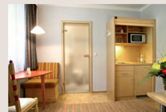
Apartment Typ 1 mit Essecke und Kitchenette.

Ab 30 Tagen Aufenthalt ist die Nutzung der Kitchenette jeweils in der Apartment- pauschale inbegriffen. Bei kürzeren Mietzeiten (mind. 4 Nächte) kann die Kitchenette bzw. Kleinküche gegen Gebühr extra dazu gemietet werden.