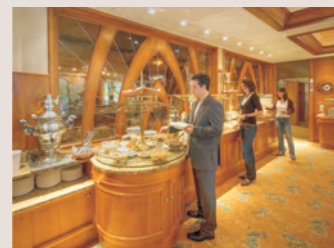
Frühstück vom Buffet im Lobby-Café.

einfach dazubuchen: Täglich ab 7–10.30 Uhr und Sa./So. bis 11.30 Uhr wartet im Hotel Hohenlohe eine üppige Auswahl am Frühstücksbuffet mit vielerlei Brötchen & Brot, Wurst, Käse, Eierspeisen, Vollwertkost, Saftbar, frischen Früchten u.v.m.