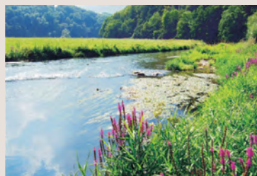
Wilde, kaum gebändigte Natur im Jagsttal – eines der letzten Paradiese für seltene Pflanzen und Tiere.