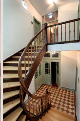
Original erhaltenes Treppenhaus in der Stadtvilla.