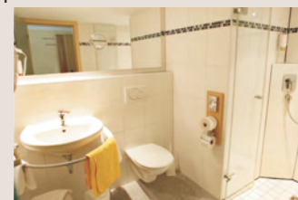
Modernes Bad mit bodengleicher Dusche.